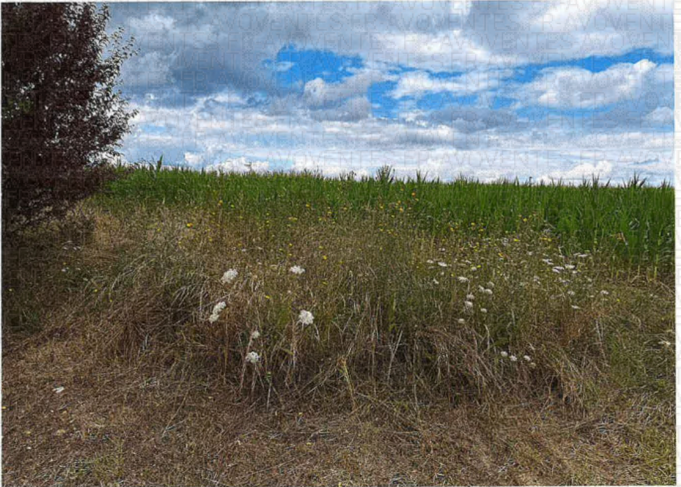
Parcelle 37 lot 1