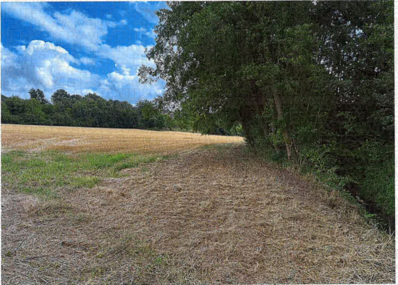
Parcelles 58 et 60 lots 2 et 3