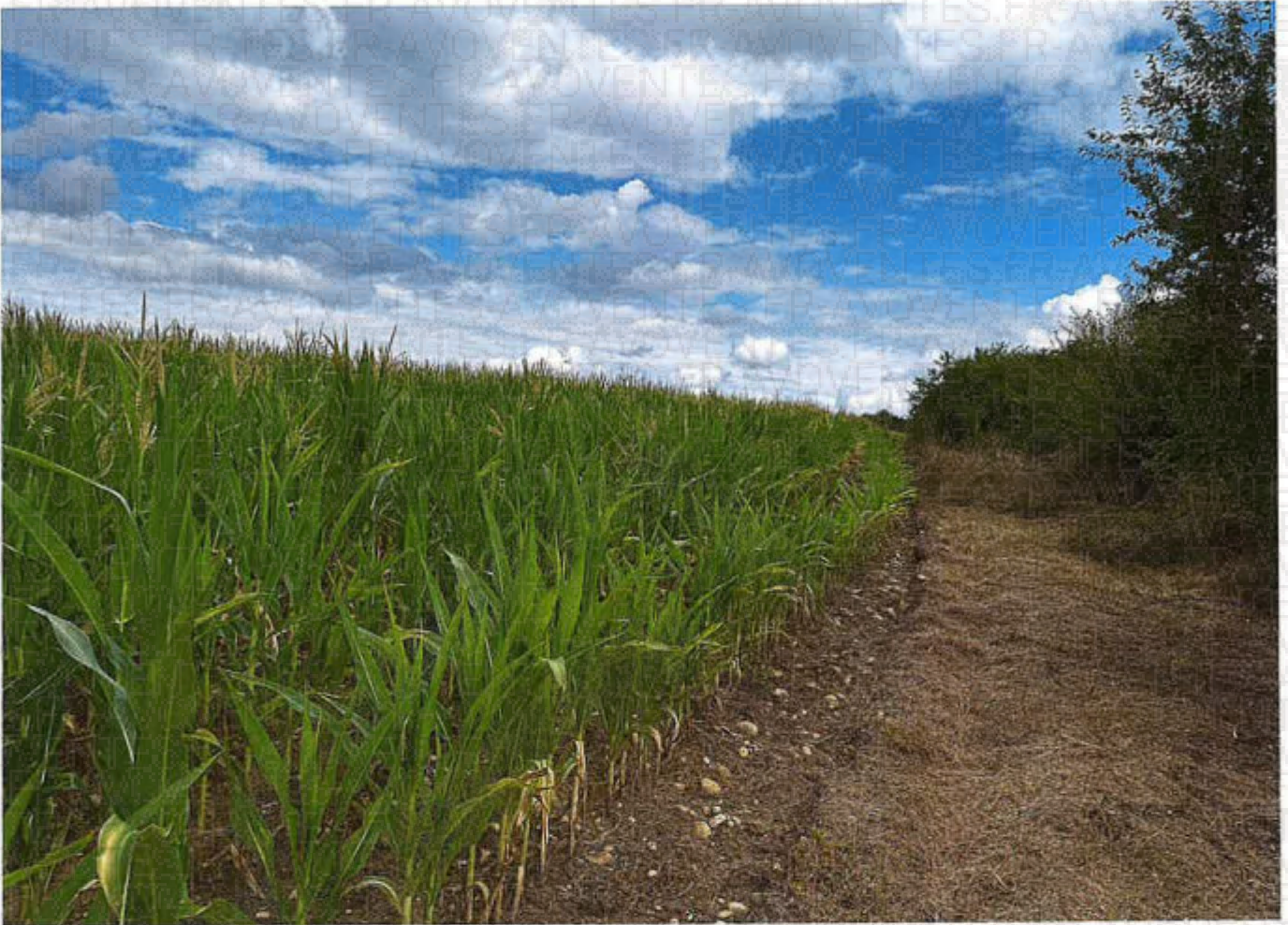
Parcelle 97 lot 1