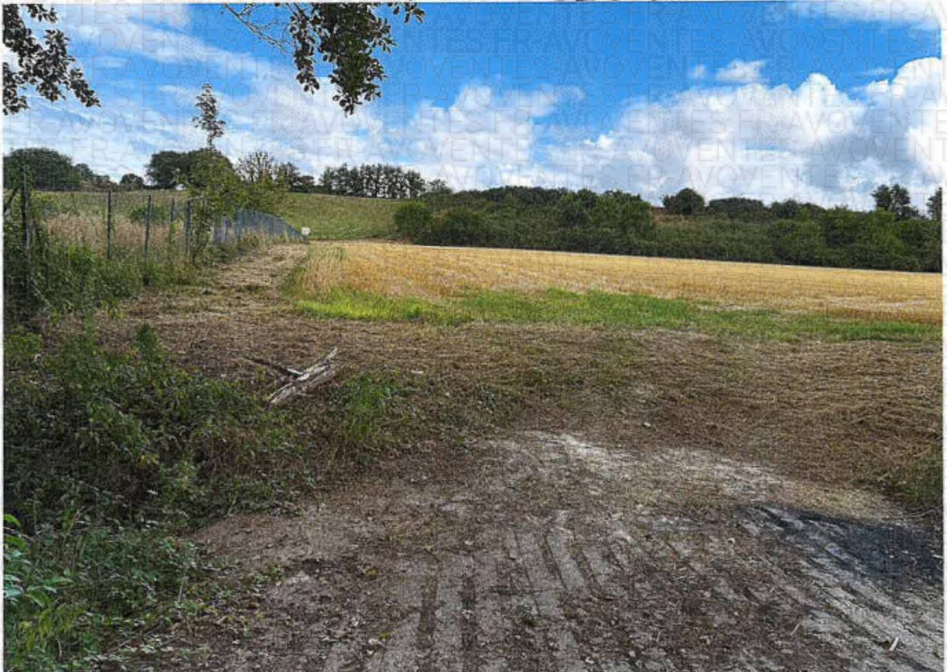
Parcelles 59 et 60 lots 2 et 3