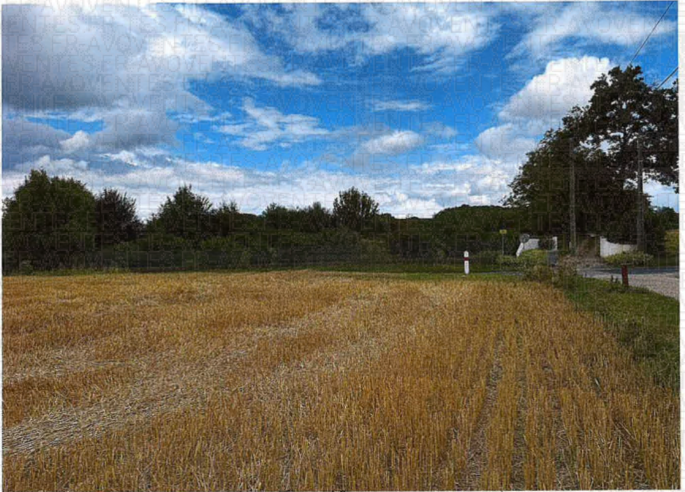
Parcelles 59 et 60 lots 2 et 3