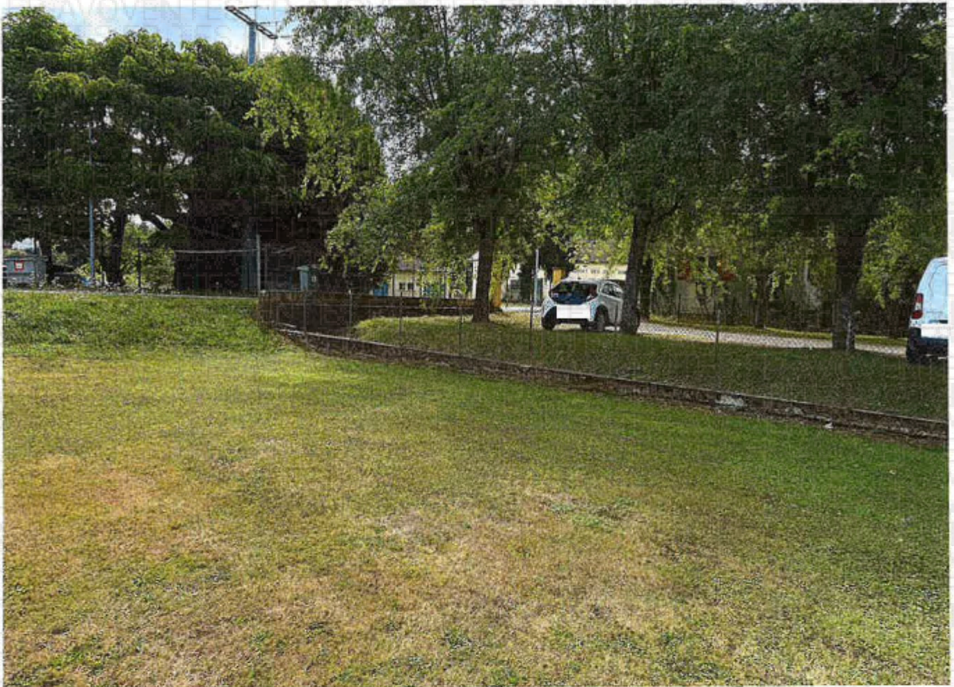
Parcelle 145 lot 5