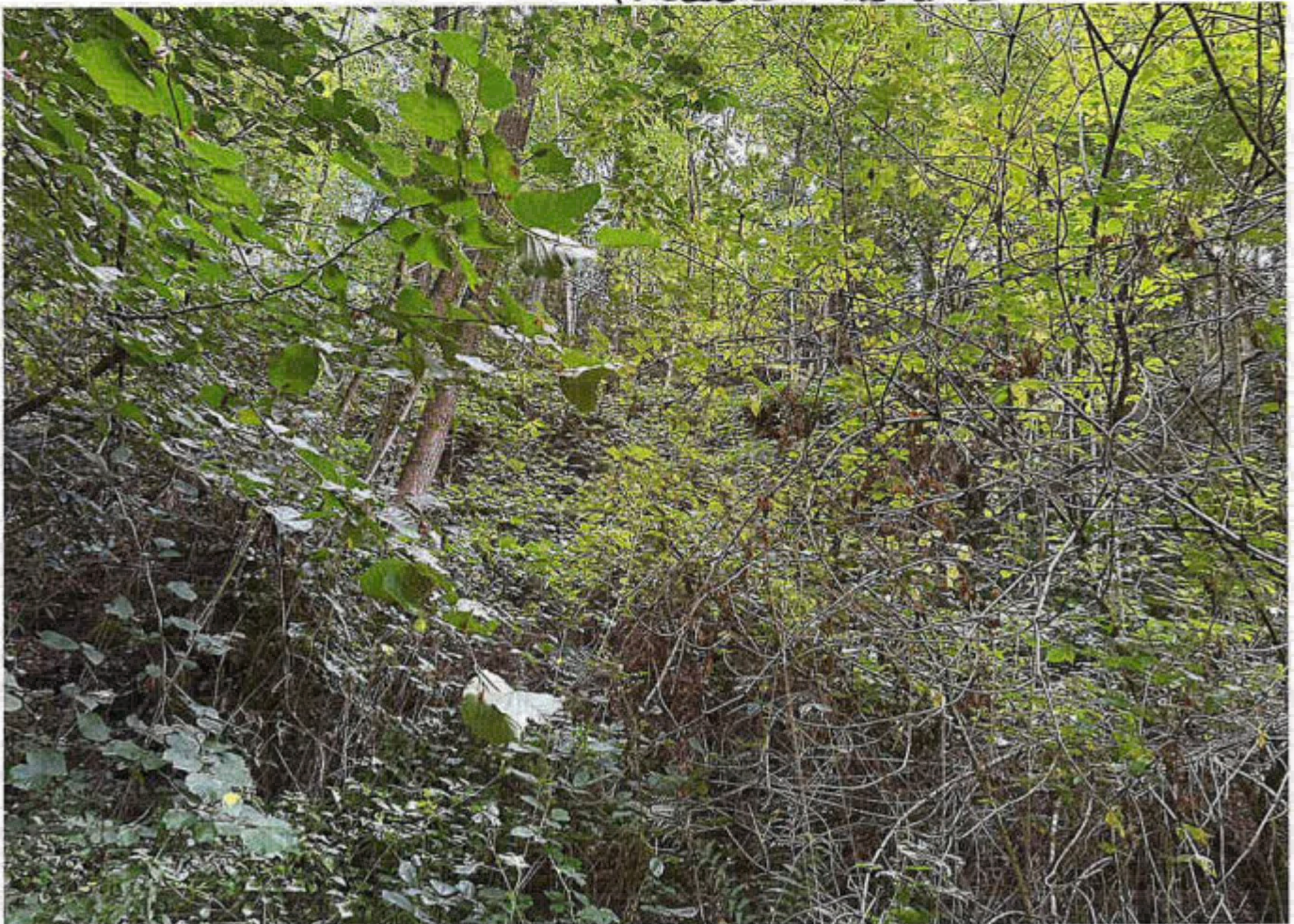
Parcelle 63 lot 4