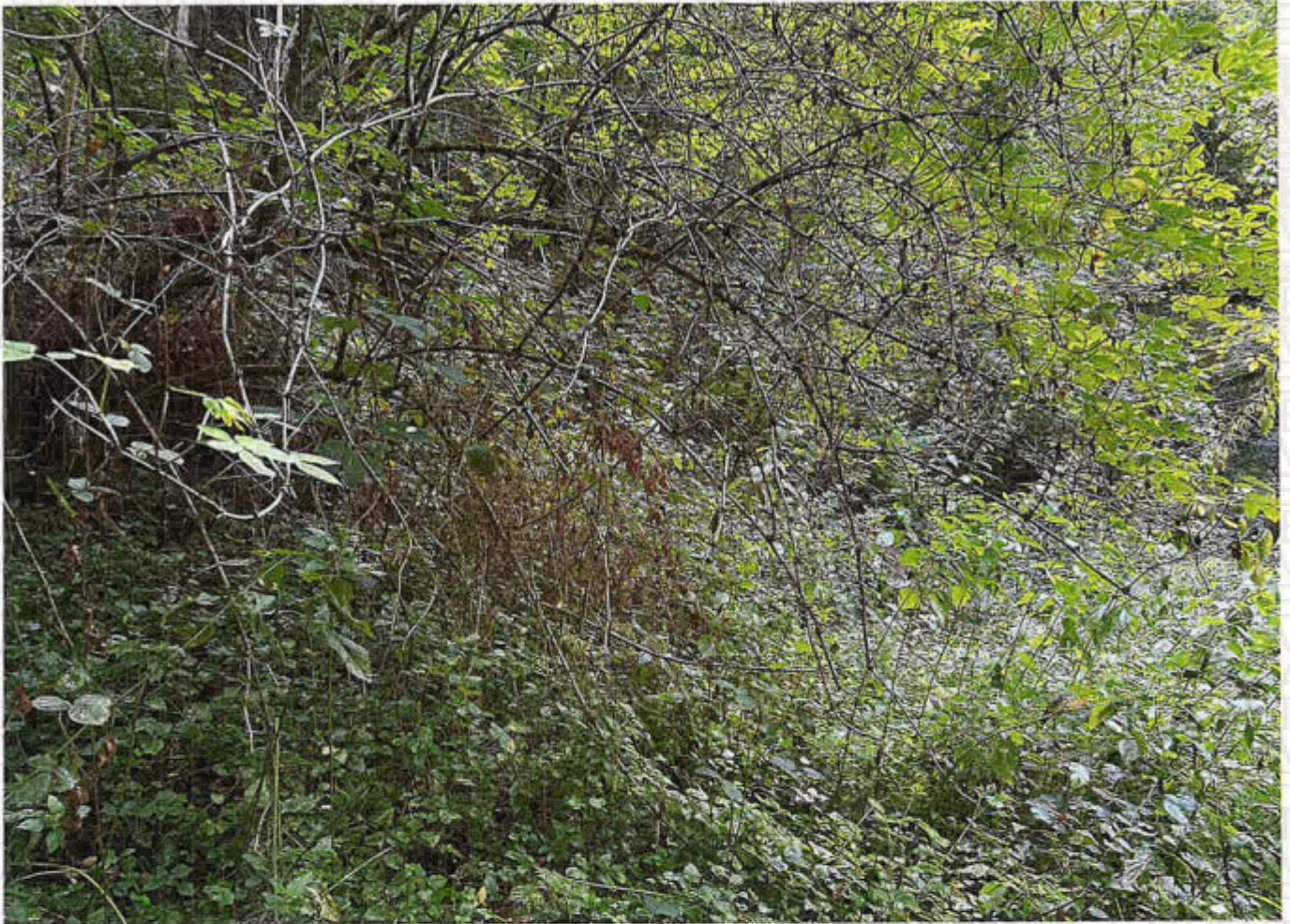
Parcelle 63 lot 4