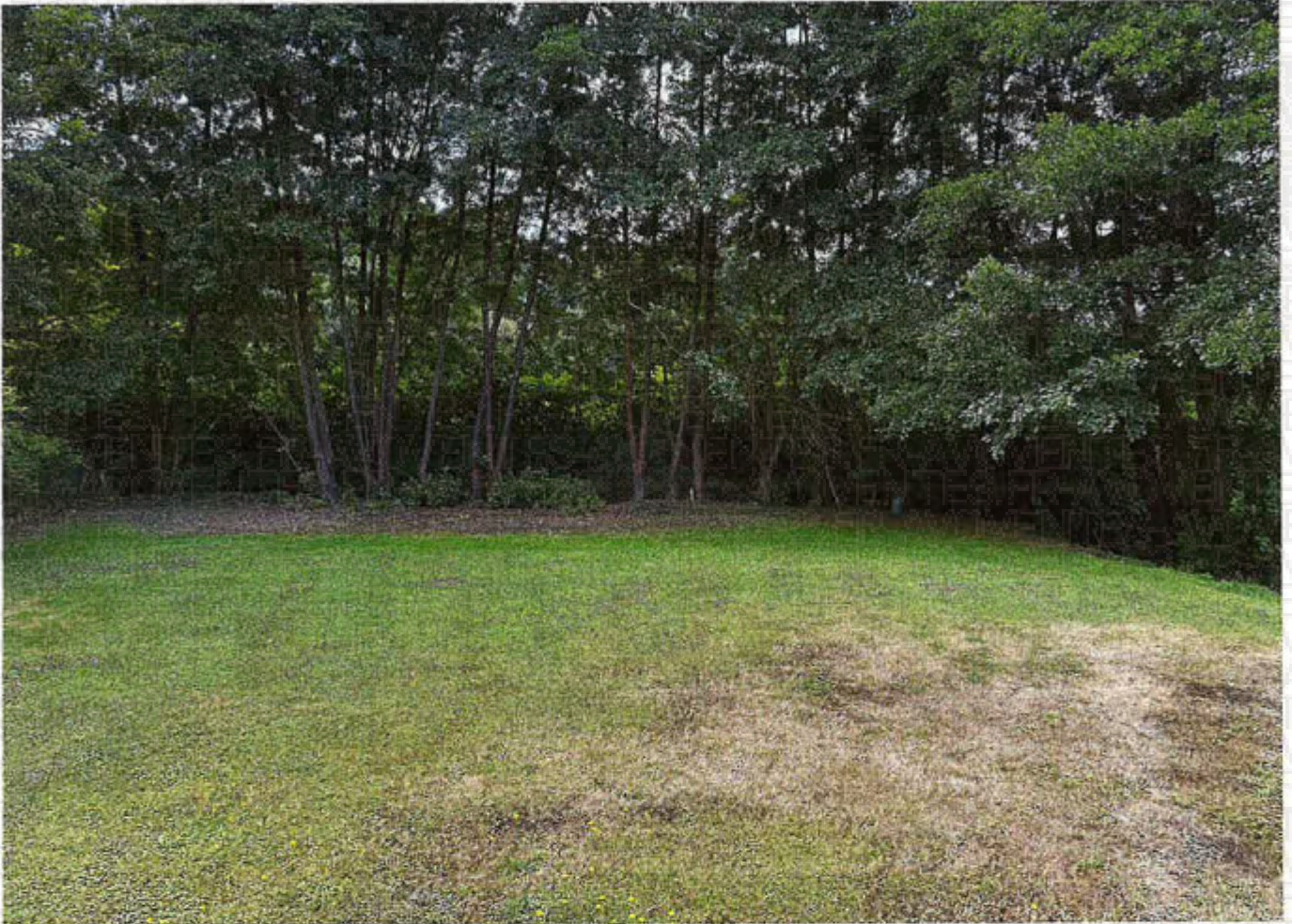
Parcelle 165 lot 5