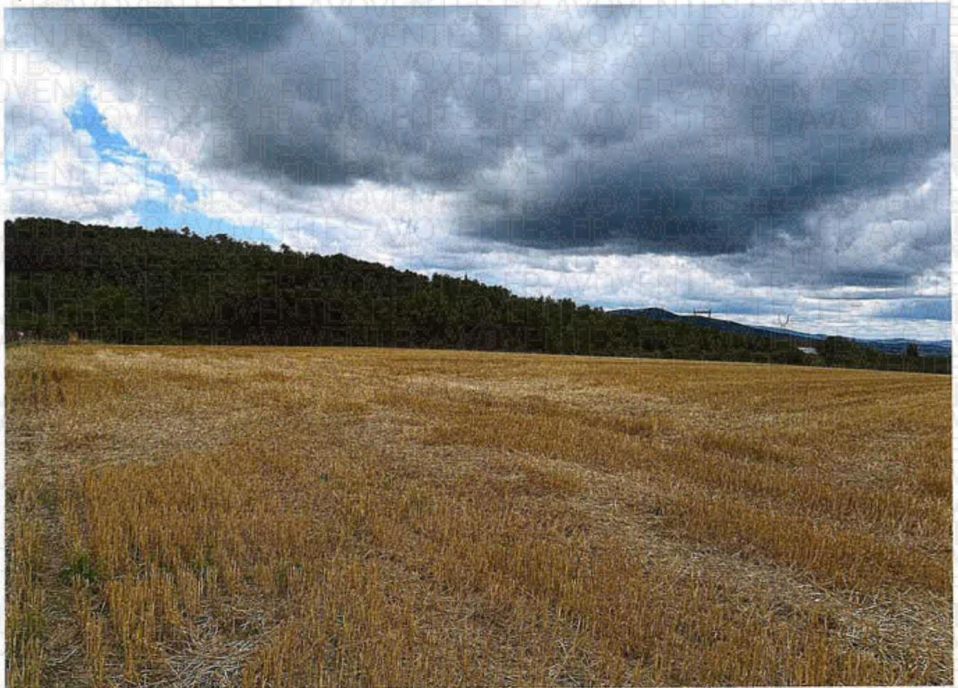
Parcelles 59 et 60 lots 2 et 3