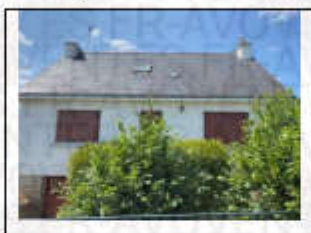
Photo générale de l'immeuble

Il ne peut être reproduit ou utilisé que dans son intégralité.