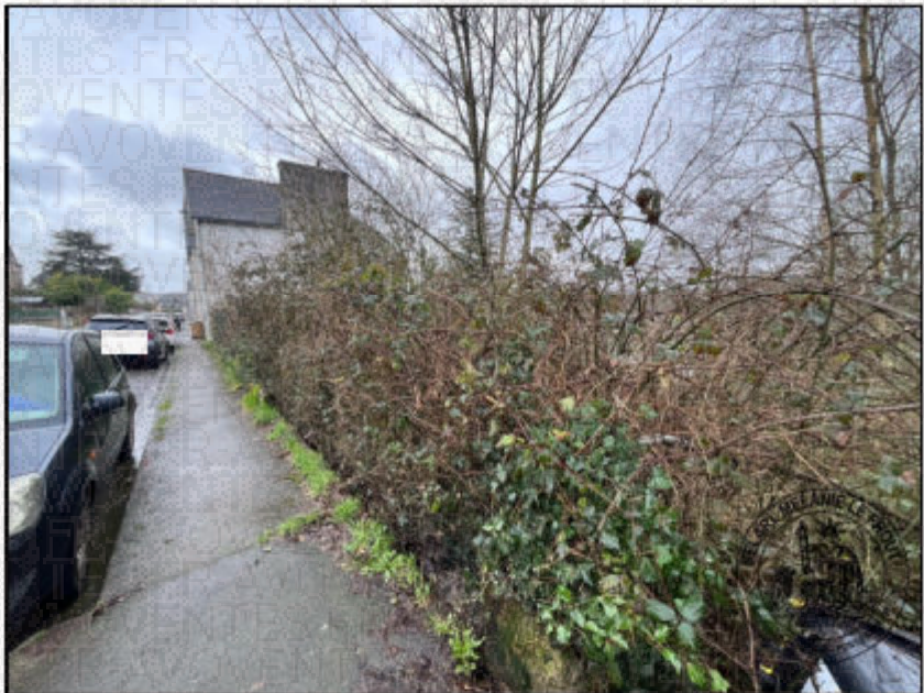
Photographie n°9. (04/02/2026)