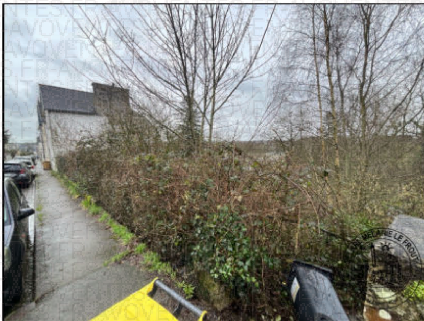
Photographie n°2. (04/02/2026)