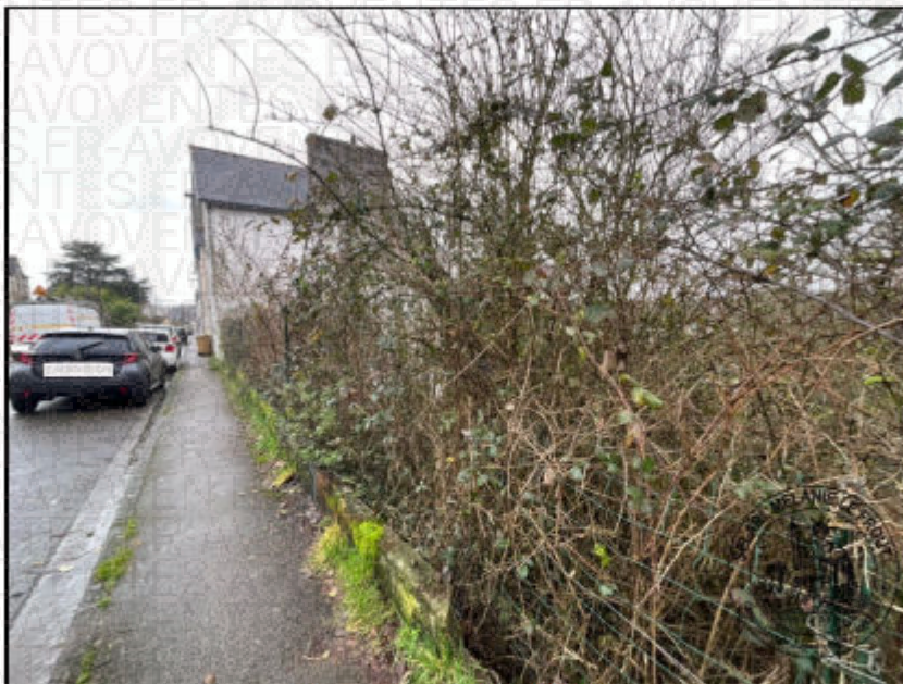
Photographie n°10. (04/02/2026)