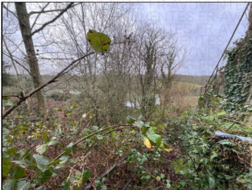
Photographie n°6. (04/02/2026)