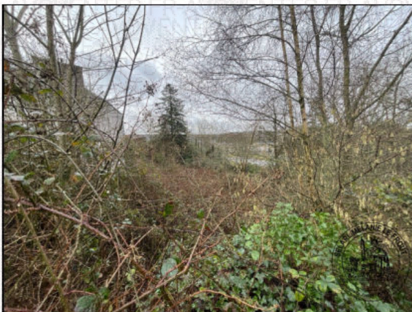
Photographie n°7. (04/02/2026)