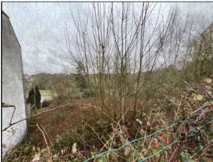
Photographie n°12. (04/02/2026)