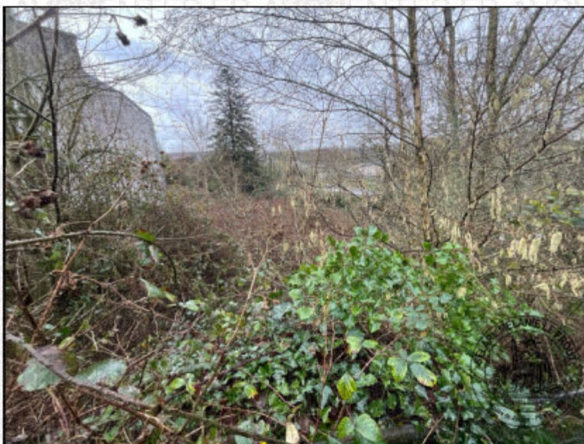
Photographie n°5. (04/02/2026)