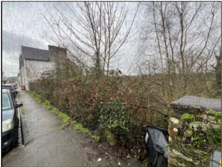
Photographie n°8. (04/02/2026)