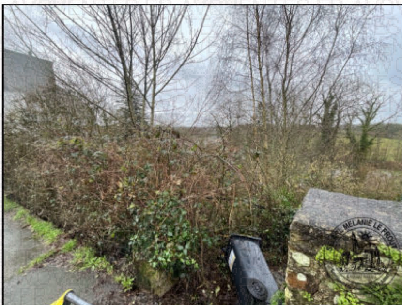
Photographie n°3. (04/02/2026)