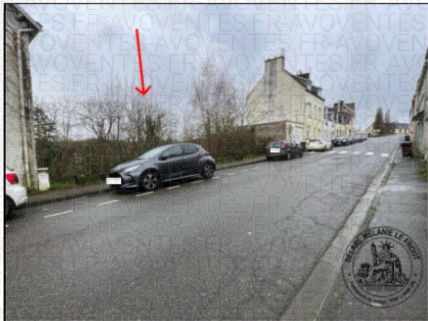
Photographie n°1. (04/02/2026)