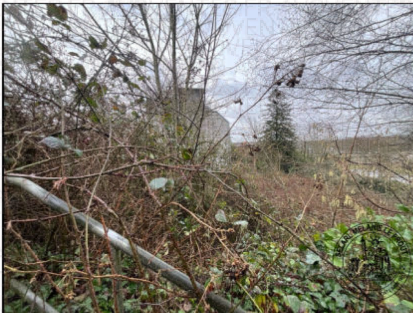
Photographie n°4. (04/02/2026)