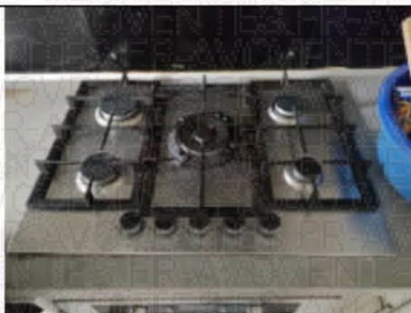
Photo n° PhGaz001 Localisation : Cuisine Table de cuisson Non visible (Type : Non raccordé)