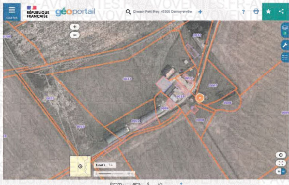
Photographie n°1. Image fournie à titre d'illustration (21/10/2024 13:34:22)

Le bien immobilier objet du procès-verbal de description est une maison édifée sur deux niveaux comprenant 5 pièces, maison comprise dans un groupe de bâtiment formant un corps de ferme. Les autres bâtiments sont des bâtiments agricole. Se trouvent également sur les parcelles deux poulaillers destinés à l'élevage industriel des poulets.