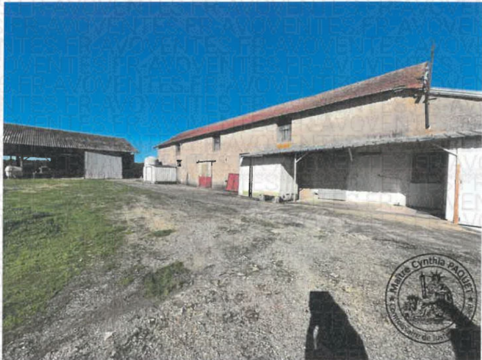
Photographie n°2. (21/10/2024 14:45:06)

GPS : Latitude=47.54862, Longitude=2.61076, Altitude=208.55 m, Angle:0.00°