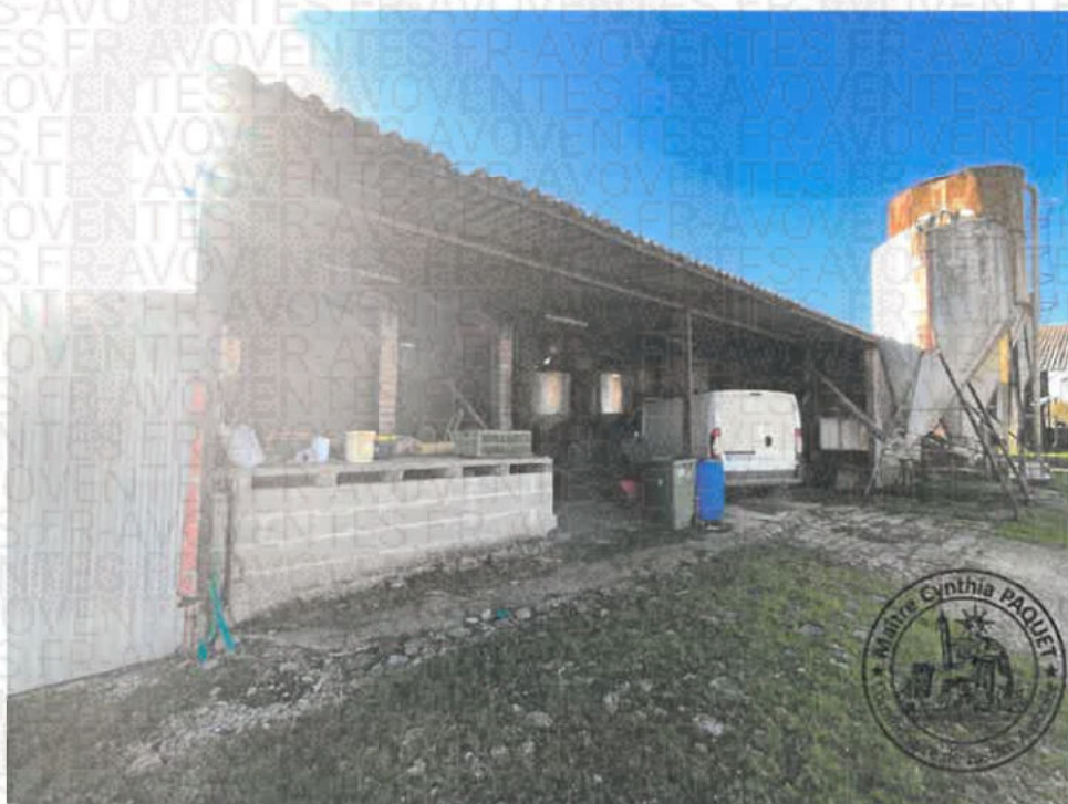
Photographie n°5. (21/10/2024 14:46:47)

Précision verticale=4.81m Précision horizontale=3.27m, Heure GMT=2024-10-21 12:45:49.