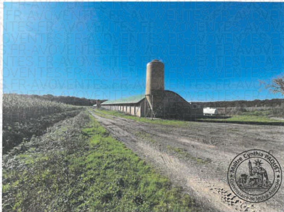
Photographie n°6. (21/10/2024 14:47:45)

GPS : Latitude=47.54823, Longitude=2.61029, Altitude=206.09 m, Angle:0.00°