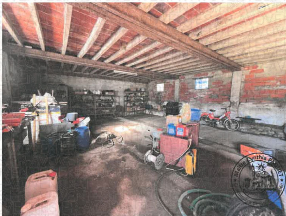
Photographie n°4. (21/10/2024 14:45:49)

GPS : Latitude=47.34881, Longitude=2.61070, Altitude=207.61 m, Angle:0.00°