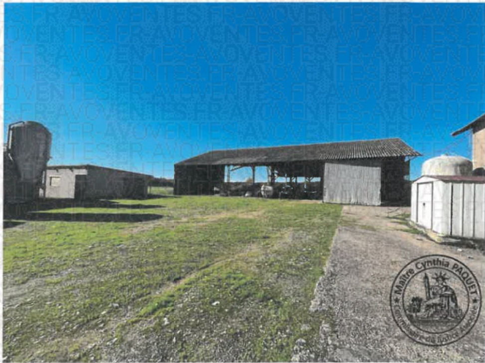
Photographie n°3. (21/10/2024 14:45:24)

Précision verticale=4.74m, Précision horizontale=3.37m, Heure GMT=2024-10-21 12:45:06.