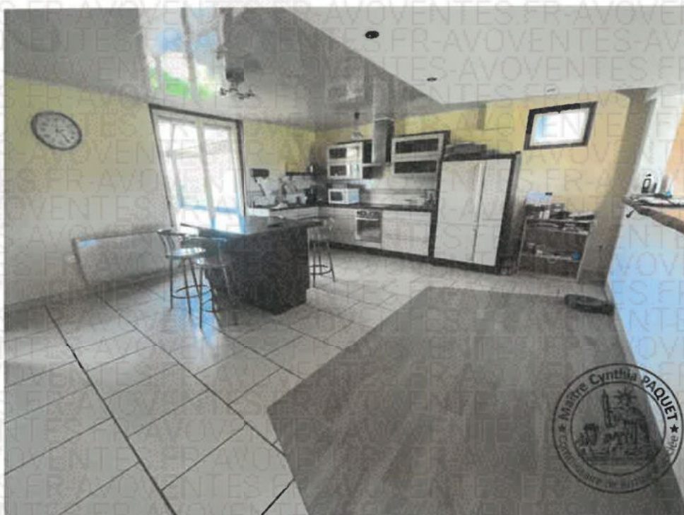
Photographie n°1. (21/10/2024 14:24:10)

La superficie de cette pièces est ce 27,81m2 environ.