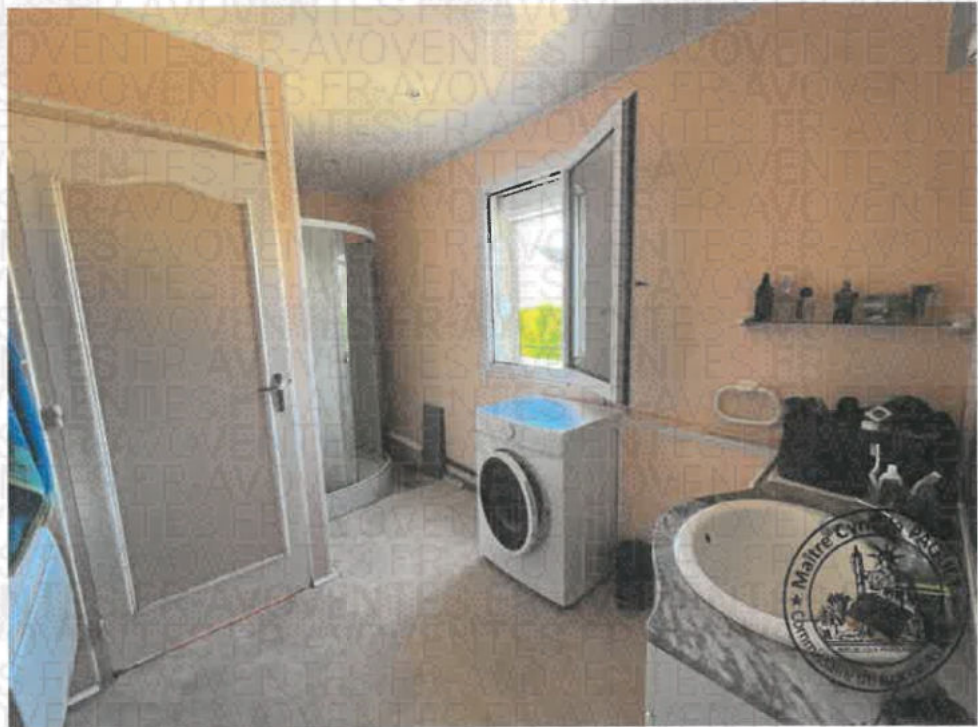
Photographie n°1. (21/10/2024 14:29:31)

La superficie de cet espace est de 1,42m 2 .