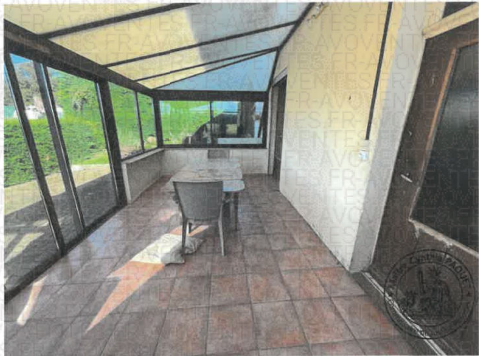
Photographie n°1. (21/10/2024 14:39:52)

La surface de cet espace est de 16,74m 2 environ.