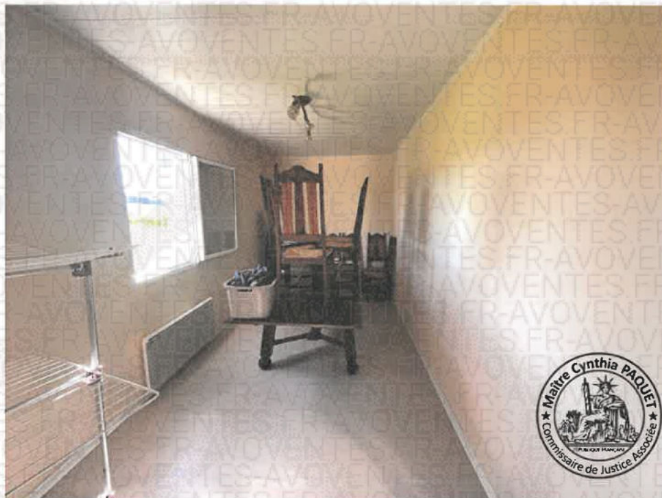
Photographie n°1. (21/10/2024 14:27:03)

La superficie de cette pièce est de 12,63 m2 environ.